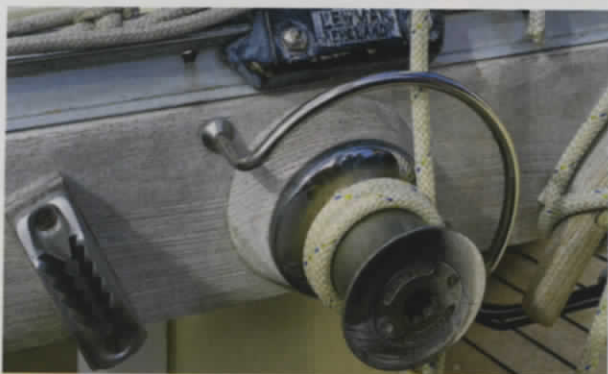
Details wie diese Großschotwinde kennzeichnen die Nautor-Schiffe der ersten Generation