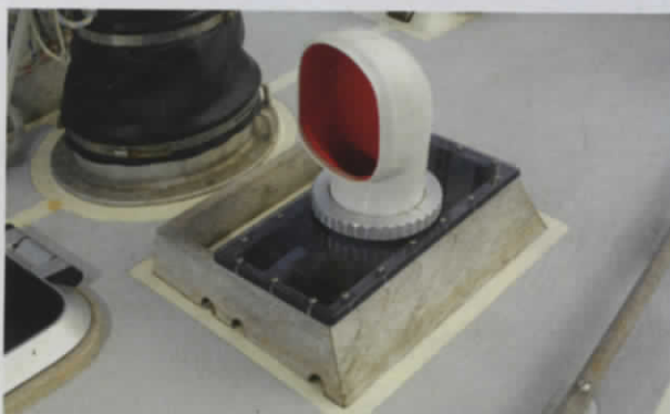
Die zahlreichen Doradelüfter weisen das Boot als Hochseeregatta-Yacht aus, gemacht für alle Wetter