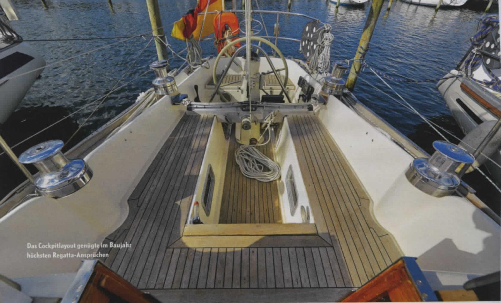
Das Cockpitlayout genügt im Baujahr höchsten Regatta-Ansprüchen