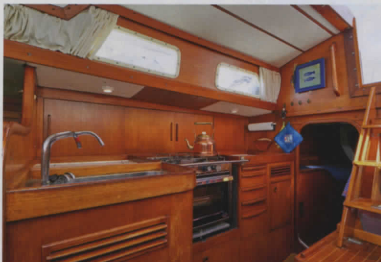
Anfang der Siebziger war diese Pantry das Maß aller Dinge. Am ruhigsten Ort im Schiff gelegen, die Spüle fast mittschiffs und ein Herd mit Backofen