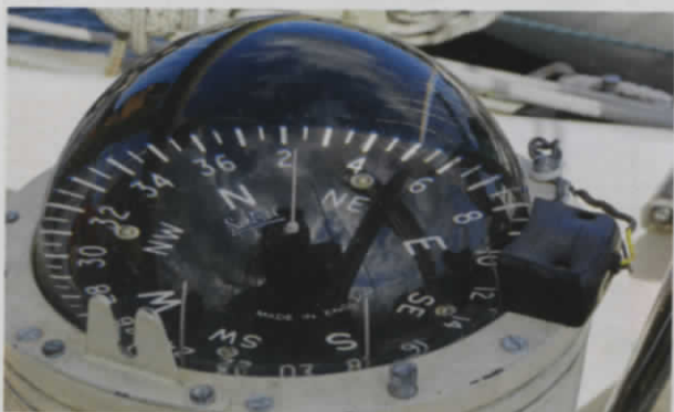
Der Kompass ist so dimensioniert, dass stundenlanges Kurshalten von Hand problemlos möglich ist